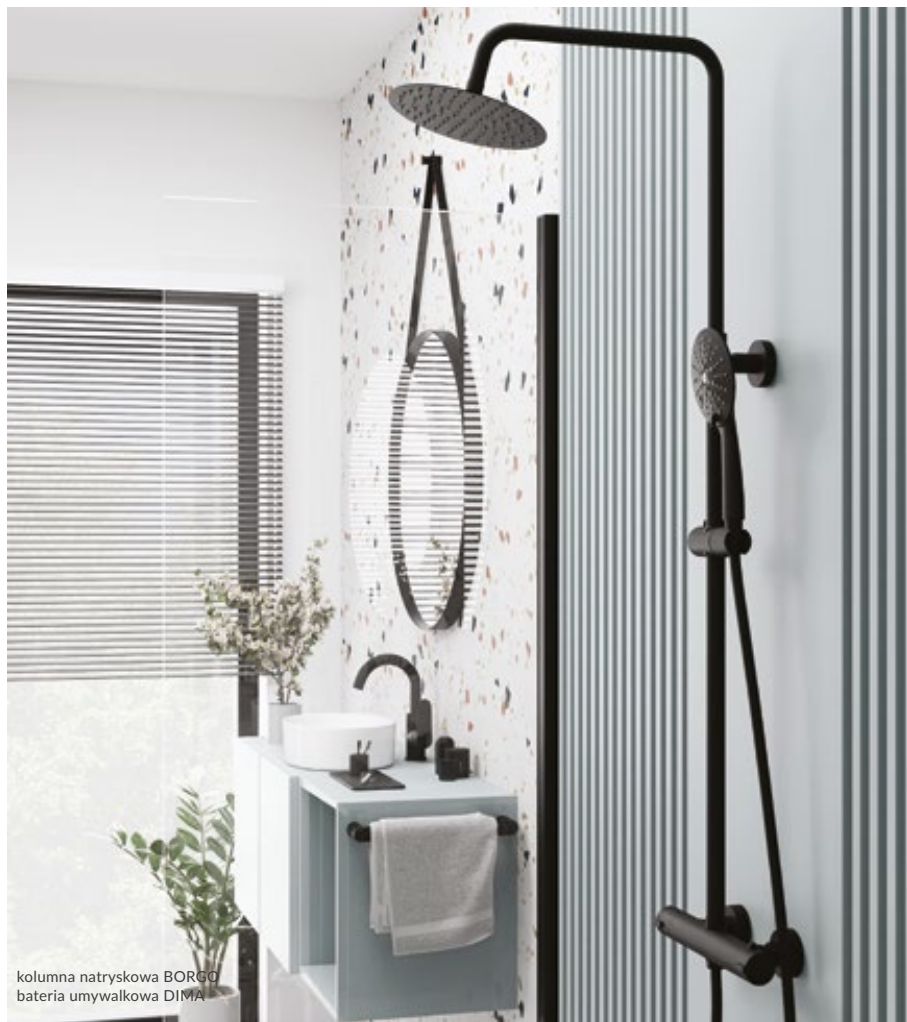
kolumna natryskowa BORGO bateria umywalkowa DIMA