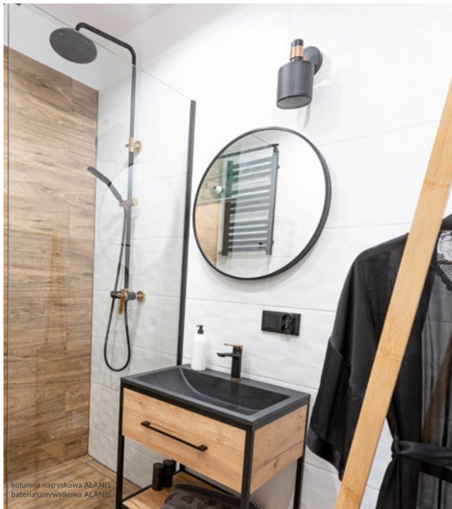
kolumna natryskowa ALANIS bateria umywalkowa ALANIS